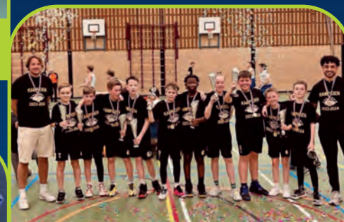
BLACK EAGLES [NL]