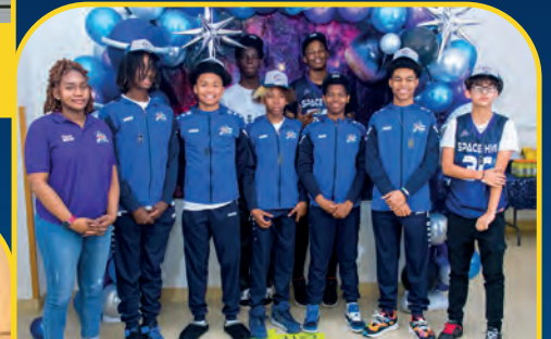
SPACE HIGH ELITE [USA]