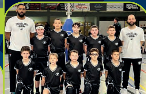
T71 DUDELANGE [L]