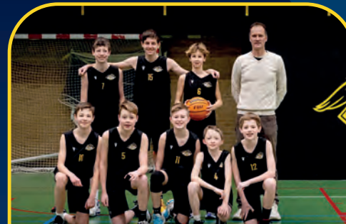
BLACK EAGLES [NL]