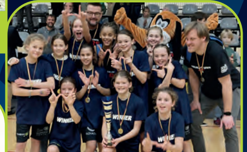
KORTRIJK SPURS [BE]