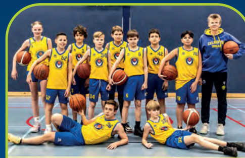
CELERITAS DONAR [NL]