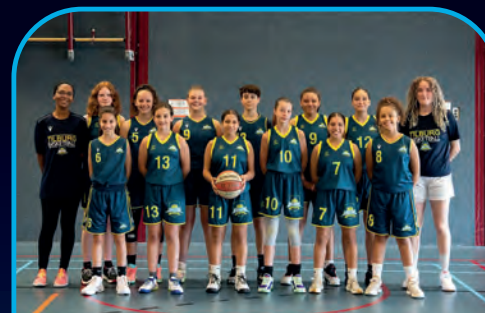
HIGH FIVE [NL]