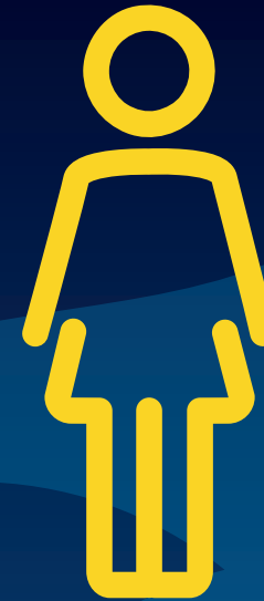
ROOM 1 AND 2