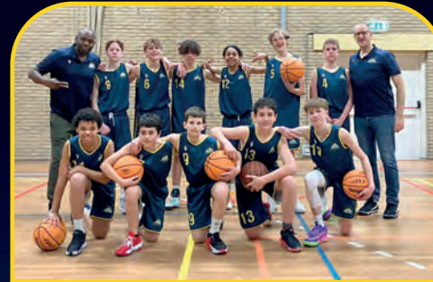
HIGH FIVE 2 [NL]