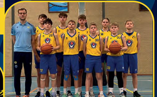
CELERITAS DONAR [NL]