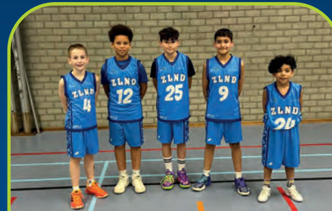
ZLND WAVES [NL]