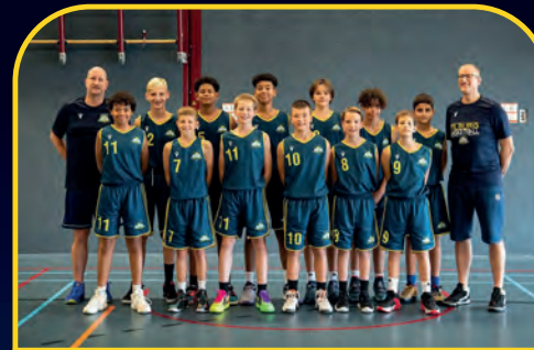
HIGH FIVE 1 [NL]