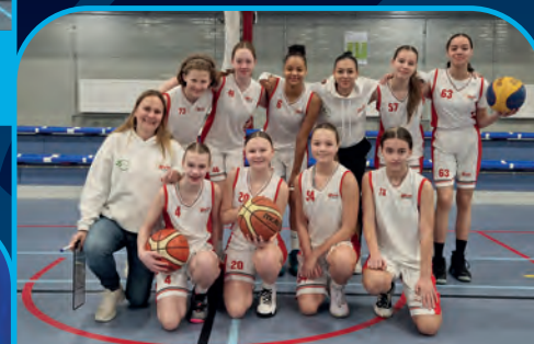
BV HOOFDDORP [NL]