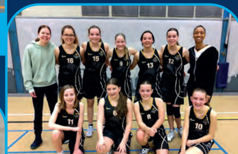
BC CANGEROES [NL]