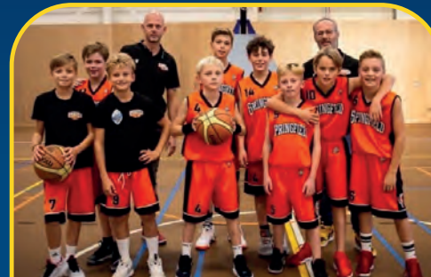
BV SPRINGFIELD [NL]