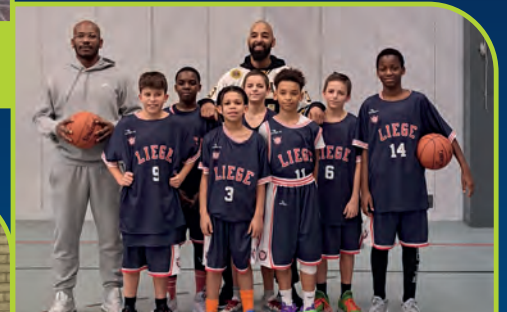
LIEGE NATION [BE]