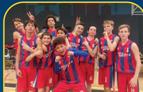
LANDSLAKE LIONS [NL]