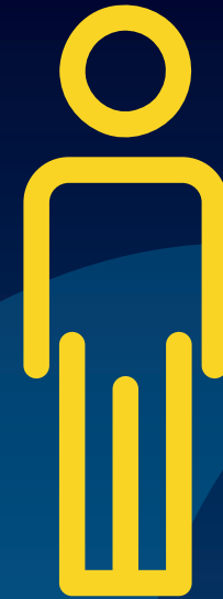
ROOM 3, 4, 5 AND 6