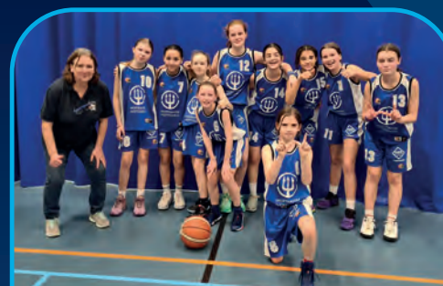
BAVI GENT [BE]