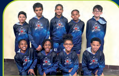
SPACE HIGH ELITE [USA]