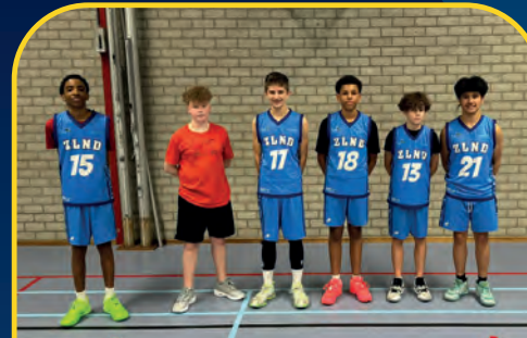
ZLND WAVES [NL]