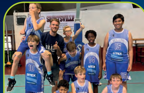
NIEUW BRABO ANTWERPEN [BE]