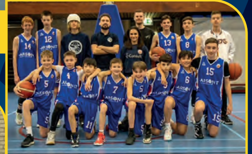
CBV BINNENLAND [NL]