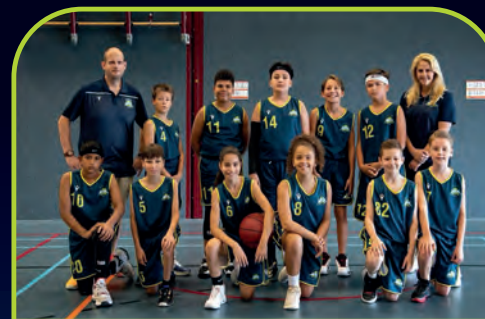
HIGH FIVE [NL]

MET SPECIALE DANK AAN KLUSBEDRIJF R. SMITS