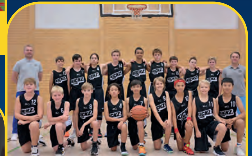
FALCONS BAD HOMBURG [D]